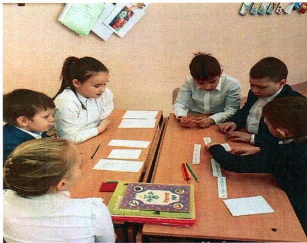
«Нравственные уроки в рассказе Е.И. Носова «Кукла». 7 класс